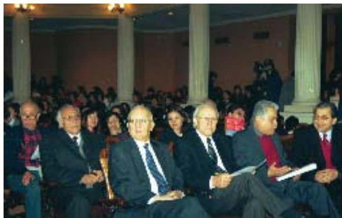
El Congreso U Joven contó en su apertura con la presencia de diversas autoridades de la Universidad, quienes junto con centenares de estudiantes comenzaron a vivir la exposición.