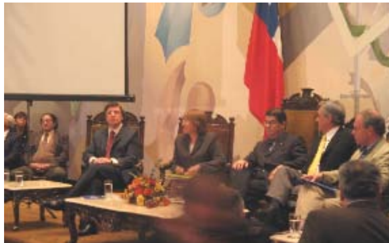
Los cuatro candidatos presidenciales asistieron al debate donde expusieron sus ideas sobre educación y respondieron las preguntas consultadas por los Premios Nacionales presentes en el debate.

Hirsh destacó asimismo, el papel protagónico que las universidades deben asumir respecto de la producción de conocimiento, con especial énfasis en el desarrollo de tecnología. “Un país que no invierte en investigación en ciencia, en ciencia pura y en ciencia aplicada, es un país que no puede mirar hacia el futuro”.