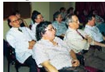
En la foto, académicos y estudiantes asistentes a la Conferencia sobre Detección de Materiales.