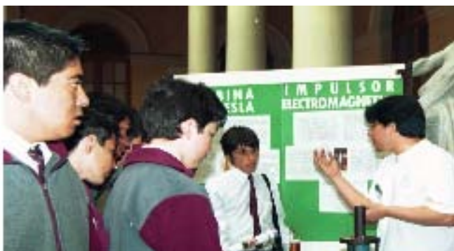
Alumnos de Física explican a visitantes de la Feria cómo funcionan los experimentos presentados. Junto a ellos, el stand de la Facultad donde se difundieron las carreras dictadas.

Las actividades del Congreso "U joven" posibilitaron también la instalación de stands informativos de las diversas carreras de la "U". A cargo del stand de Ciencias estuvo un selecto grupo de estudiantes, entre ellos estudiantes de física, quienes con sus experimentos llamaron poderosamente la atención de los asistentes.