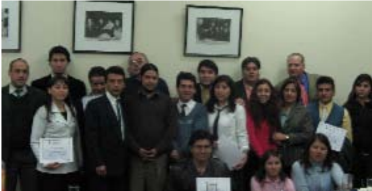
Asistentes -funcionarios y familiares de trabajadores de la Facultad de Ciencias, junto a sus profesores.

"Esta es una empresa donde se construye hacia afuera y hacia adentro, y donde el construir hacia adentro significa ir sacando nuevas capacidades. Eso significa en alguna medida educar. Sacar de adentro la potencialidad y ayudar a expresarla. Cuando hacemos ese trabajo estamos haciendo universidad", señaló finalmente el Decano.